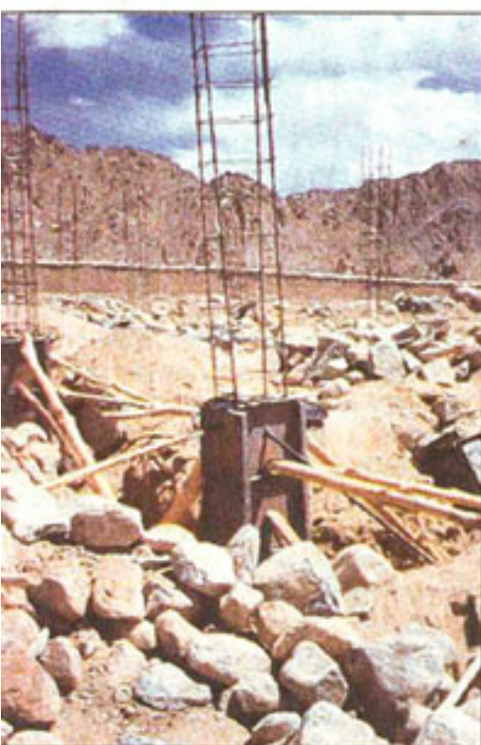
Die Baustelle in Leh. Die Vorbereitungen für die Erweiterung der Schule.

Wenn die Aktion Erfolg hat, so verspricht der Hohenkemnather, will er die Bilder von seinen Touren entlang des Zanskar der Öffentlichkeit vorstellen. Natürlich nimmt er auch zur Übergabe des Geldes für das Stromaggregat die Fotoausrüstung mit.